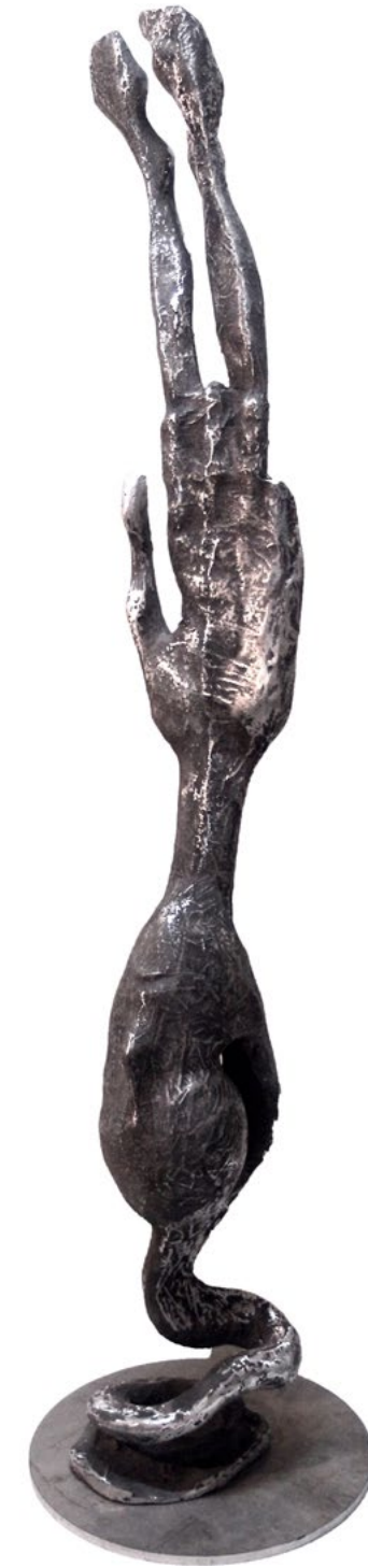
A Handful / Bir'Avuç, 2014 aluminum / alüminyum 157x24x27cm