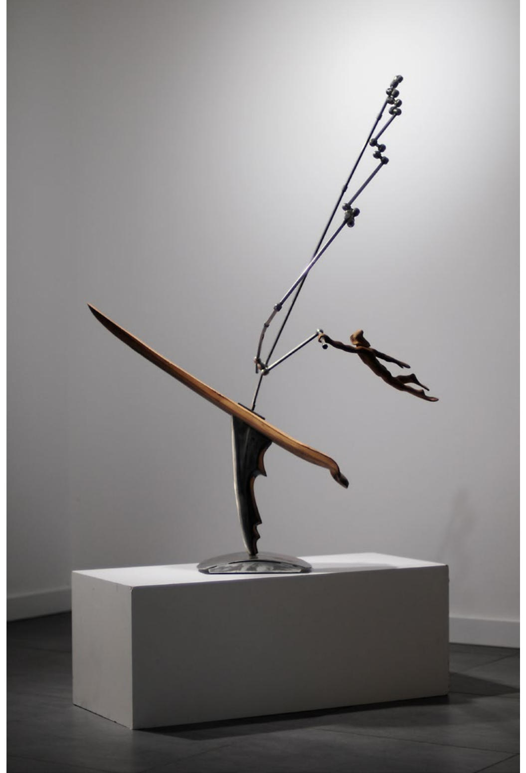
Caught In The Wind / Rüzgara Kapılan, 2014 wood - metal / ahşap - metal 130x90x60cm