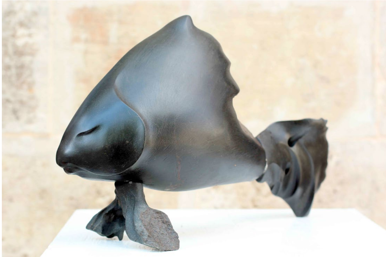
Fish I / Balık I, 2012 stone (Serpentine) / taş (Serpantin) 28x48x13cm