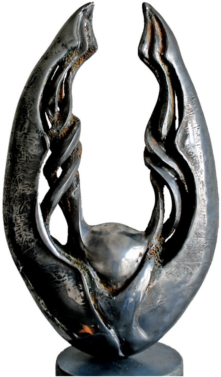
Flower / Çiçek, 2012 aluminum / alüminyum 62x38x15cm