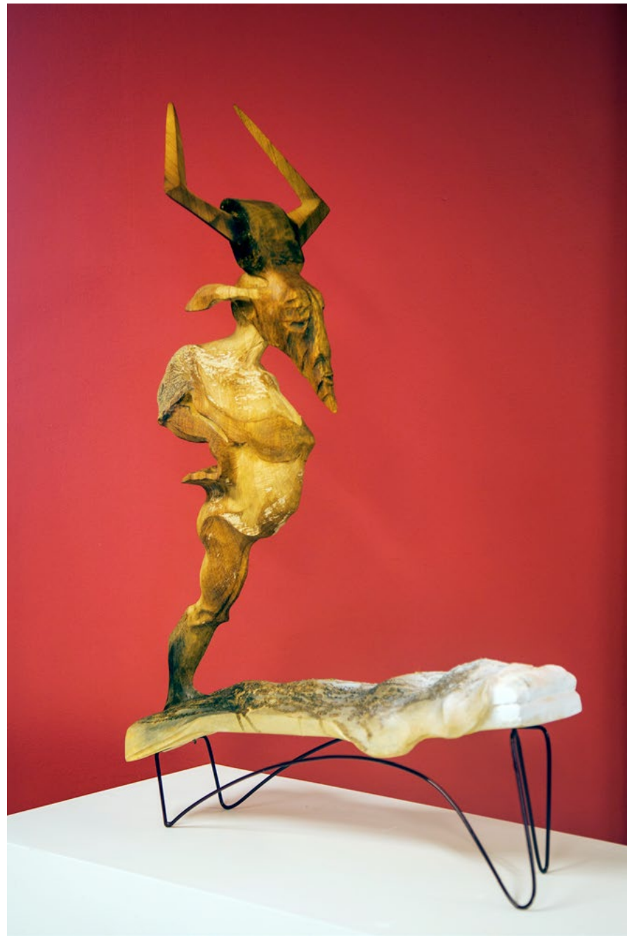
Incubus II / Karabasan II, 2013 wood / ahşap 78x50x26cm