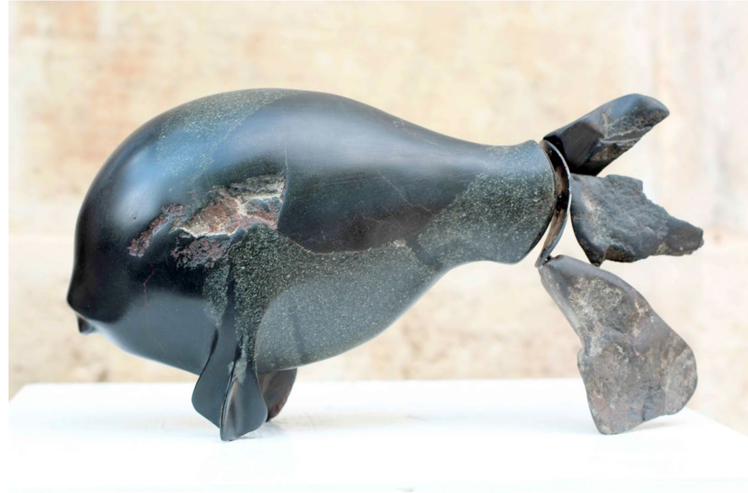
Fish IV / Balık IV, 2012 stone (Serpentine) / taş (Serpantin) 18x34x10cm