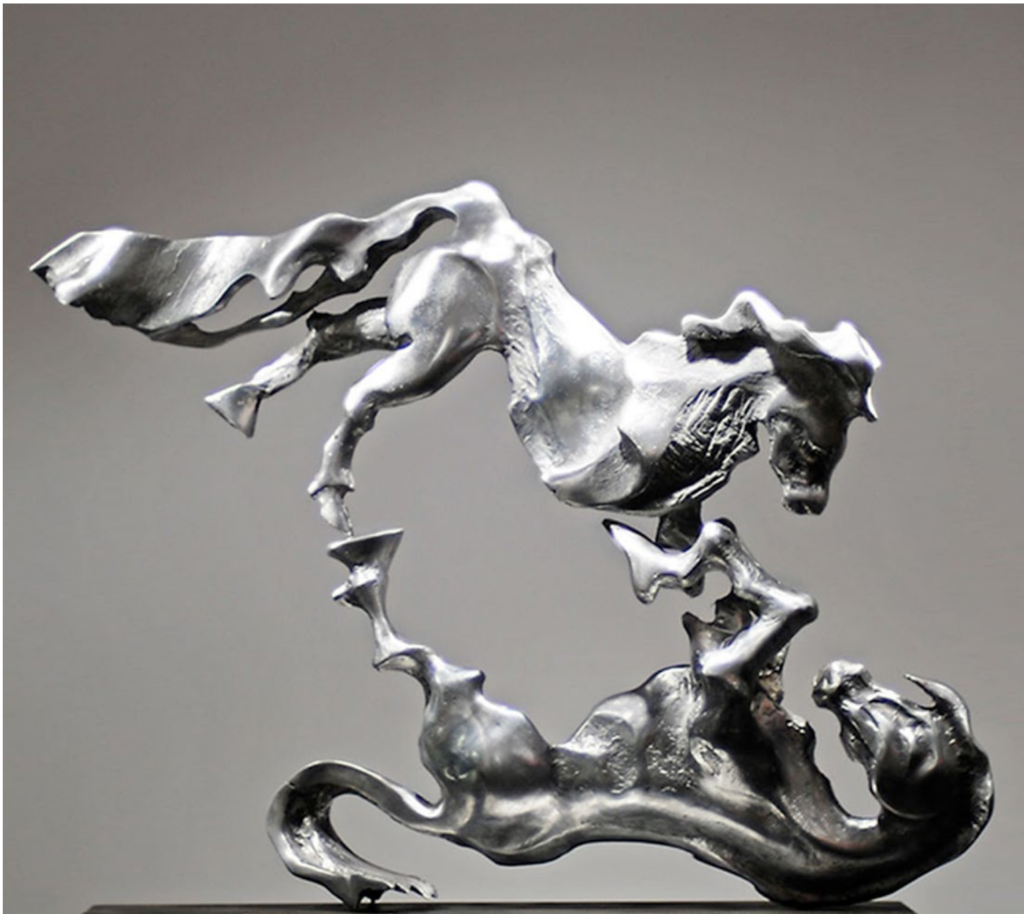
Horses / Atlar, 2014 aluminum / alüminyum 77x90x20cm