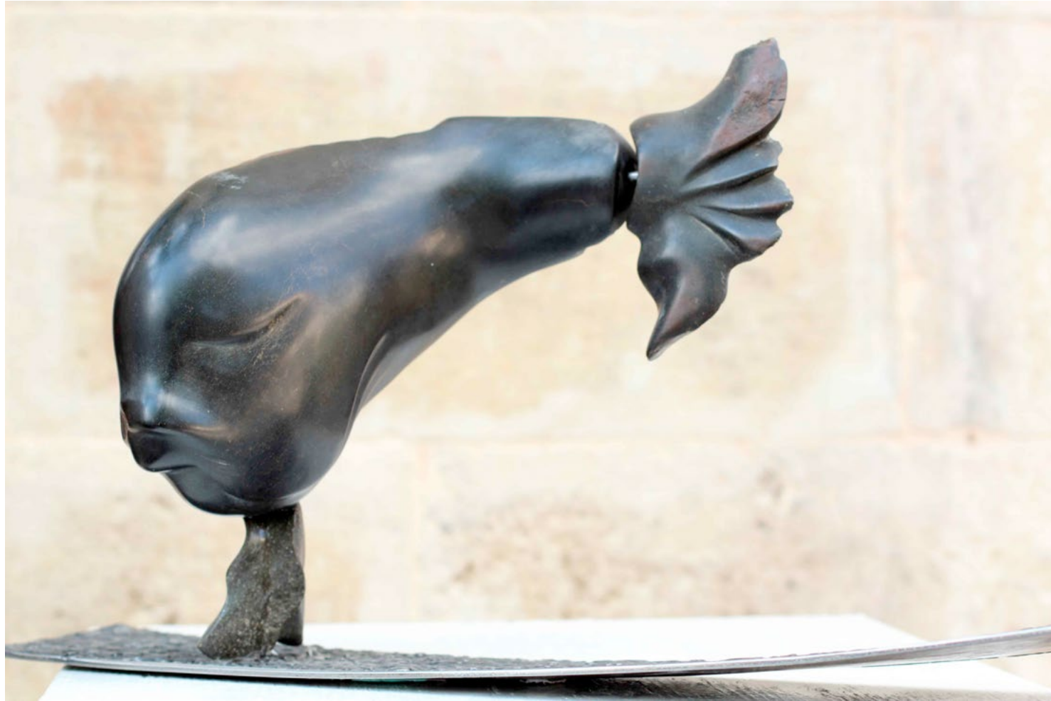
Fish III / Balık III, 2012 stone (Serpentine) / taş (Serpantin) 24x30x13cm