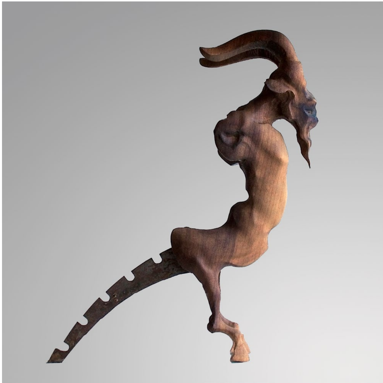
Incubus I / Karabasan I, 2013 wood - metal / ahşap - metal 55x40x10cm