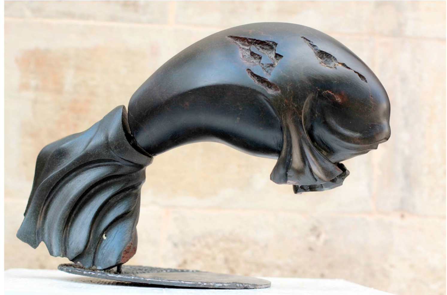
Fish II / Balık II, 2012 stone (Serpentine) / taş (Serpantin) 23x36x8cm