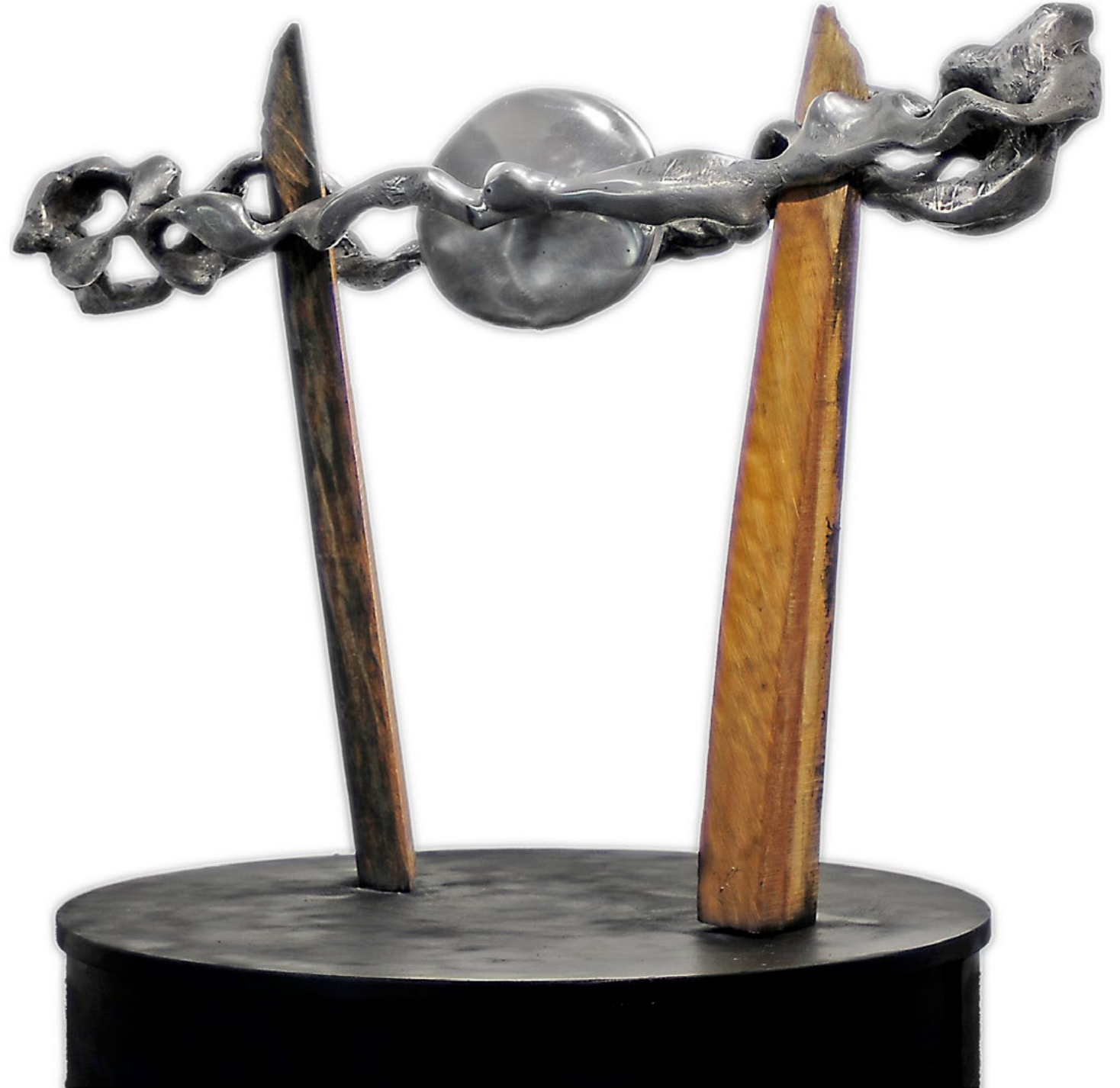
Realm / Diyar, 2014 aluminum - wood / alüminyum - ahşap 113x148x30cm