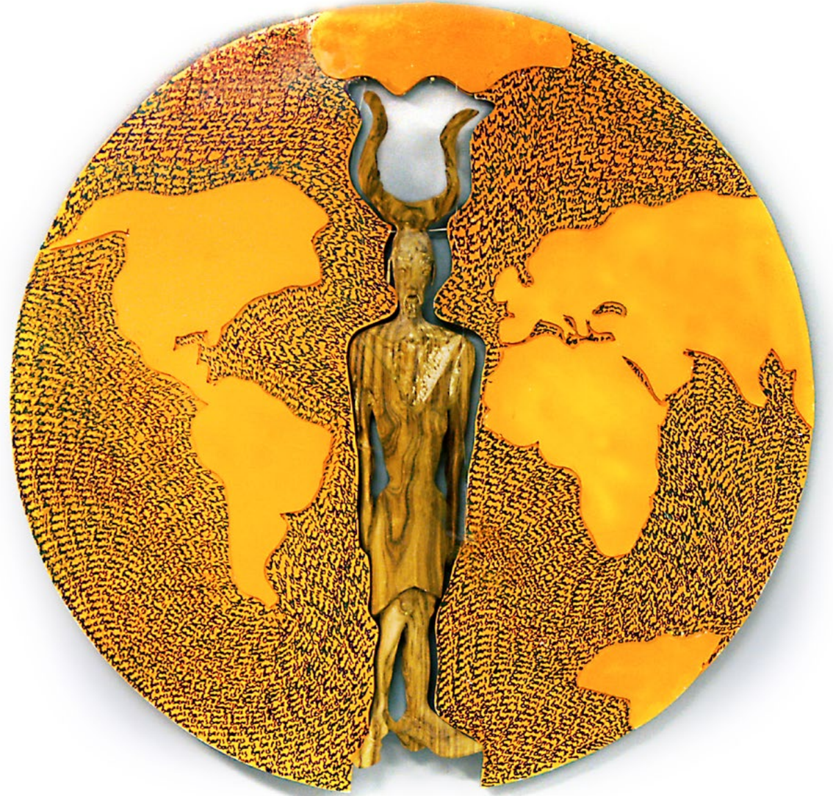
Peace / Barış, 2013 mixed media / karışık malzeme 90cm