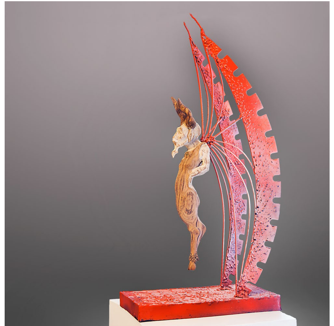
Albastı, 2013 wood - metal / ahşap - metal 71x35x20cm