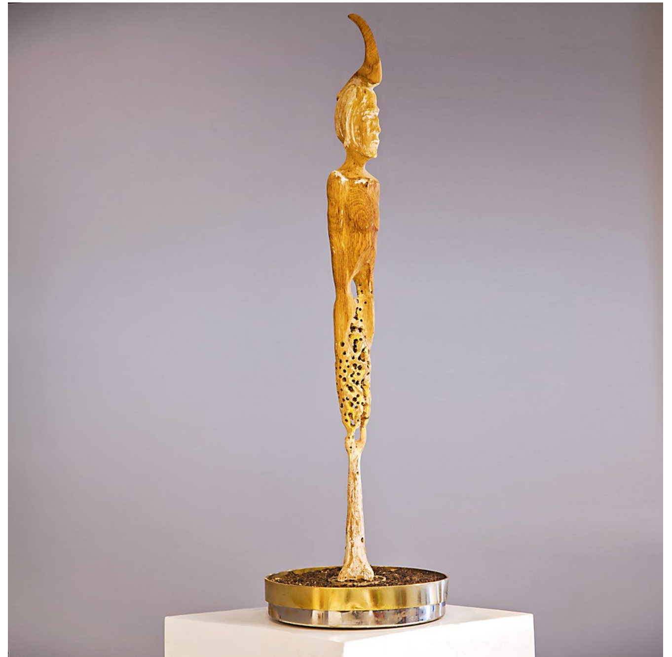
Untitled / İsimsiz, 2013 wood / ahşap 83x10x8cm