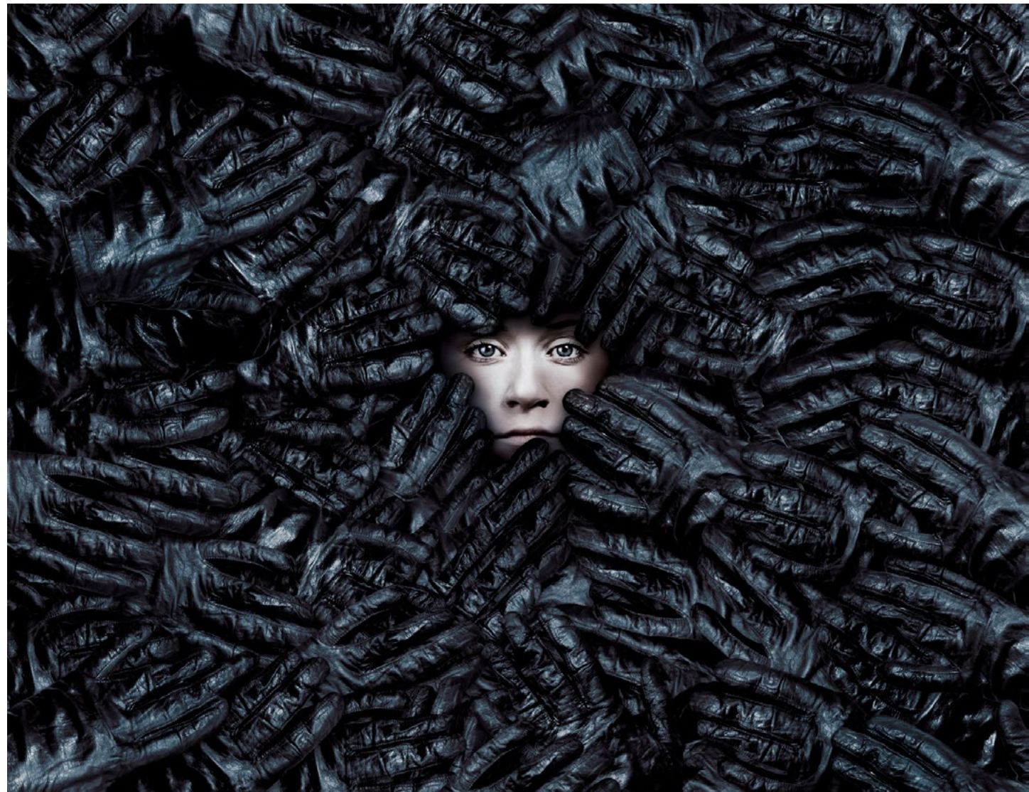
Push And See