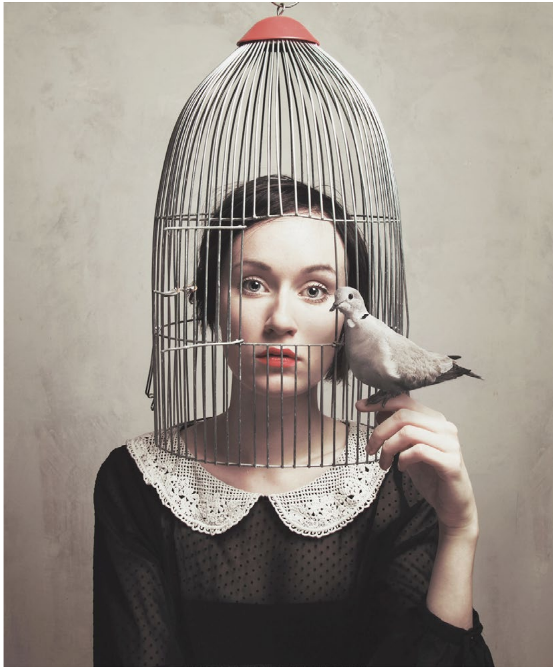
Subjective Freedom I