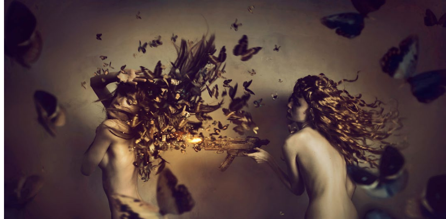
Happiness Is A Warm Gun