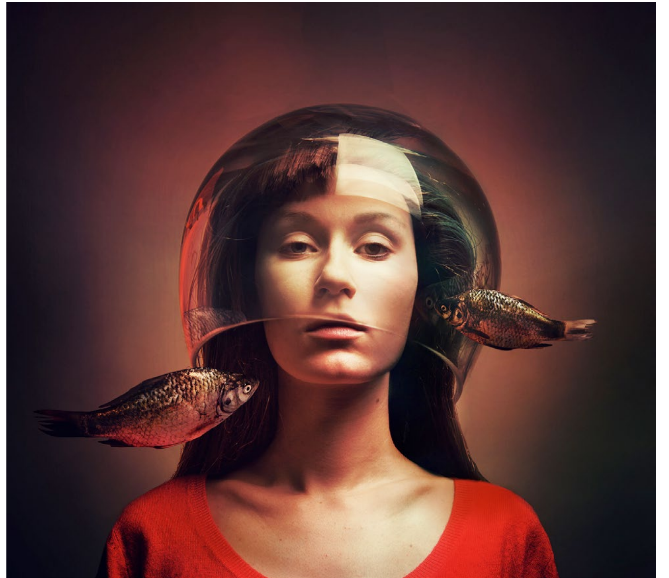
Subjective Freedom II