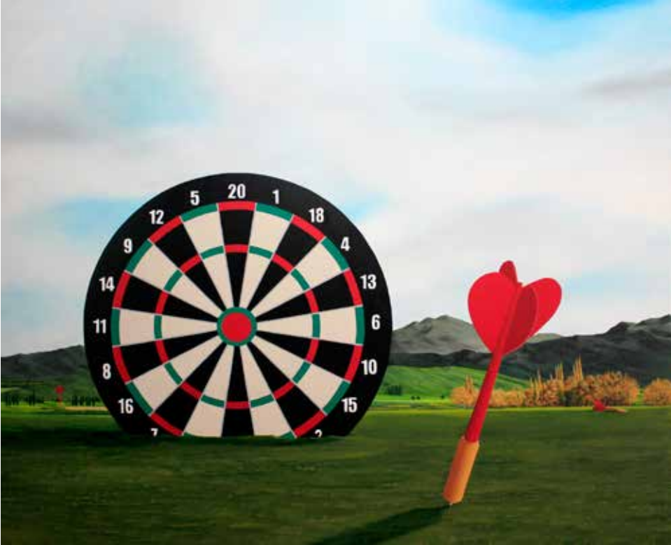
İsimsiz / Untitled, 2015 tuval üzerine akrilik / acrylic on canvas 116 x 140 cm