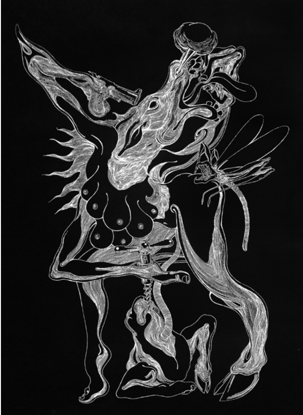
İsimsiz / Untitled, 2015 MDF üzerine akrilik kalem / acrylic pen on MDF 100 x 70 cm

Hayat denen serüvene 1983 yılında İstanbul'da başladım. Çocukluğumun getirdiği merak ve ilgi içsel dünyamı besliyor, bana yeni ufuklar açıyordu. Zamanla hayalini kurduklarım kağıt ve kalem aracılığı ile canlanmaya başladı ve resim bana düşlerimi diğer insanlarla paylaşabileceğimi gösterdi. Daha sonra okul ve meslek hayatımı çizim üzerine belirledim. Marmara Güzel sanatlar Fakültesi Grafik bölümüne ikincilikle girdim. Yeditepe Plastik Sanatlar Bölümünde Yüksek lisansımı yapıyorum. Okul ve iş hayatımı birlikte sürdürdüm ve sürdürüyorum. Marmara Güzel Sanatlar Fakültesinde Serbest Resimleme dersi vermekteyim Hayallerimin ışığında kendi dünyamın kapılarını aralamaya devam edeceğim.