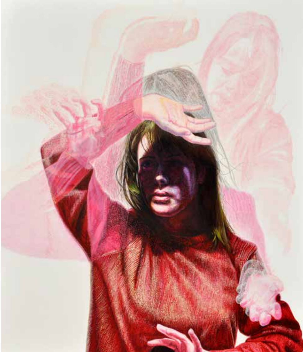
Kırmızı Emperyalistler Serisi I / Red Imperialist Series I, 2015 tuval üzerine akrilik / acrylic on canvas 180 x 156 cm

1989 yılında Kars'ta doğdu. 2007 yılında Eskişehir Anadolu Güzel Sanatlar lisesini bitirdi.