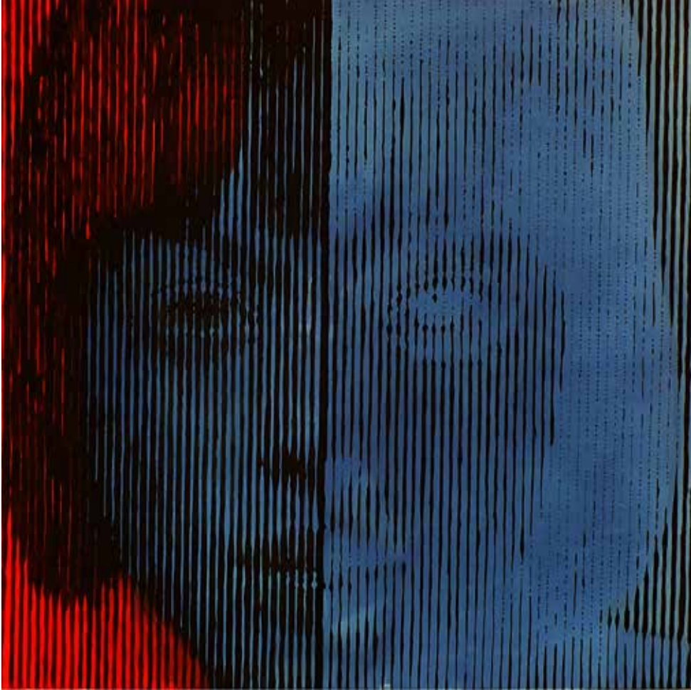
Darkness Verse No: 14, 2013 tuval üzerine yağlıboya / oil on canvas 100 x 100 cm

2000 yılından beri çeşitli uluslar arası ve ulusal gazeteler ve yayınlar ile iş birliği yaptı. İran'da çeşitli şehirlerde 30'dan fazla grup karikatür sergisi düzenledi. İran'da 10'dan fazla ulusal çizgi roman yarışmalarına ve gazetecilik festivaline katılmış ve ödül almıştır.