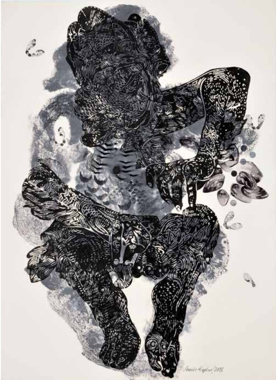
Deniz Tanrıları / Sea Gods, 2013

kağıt üzeri akrilik ve suluboya / acrylic and aquarelle on paper 105 x 75 cm