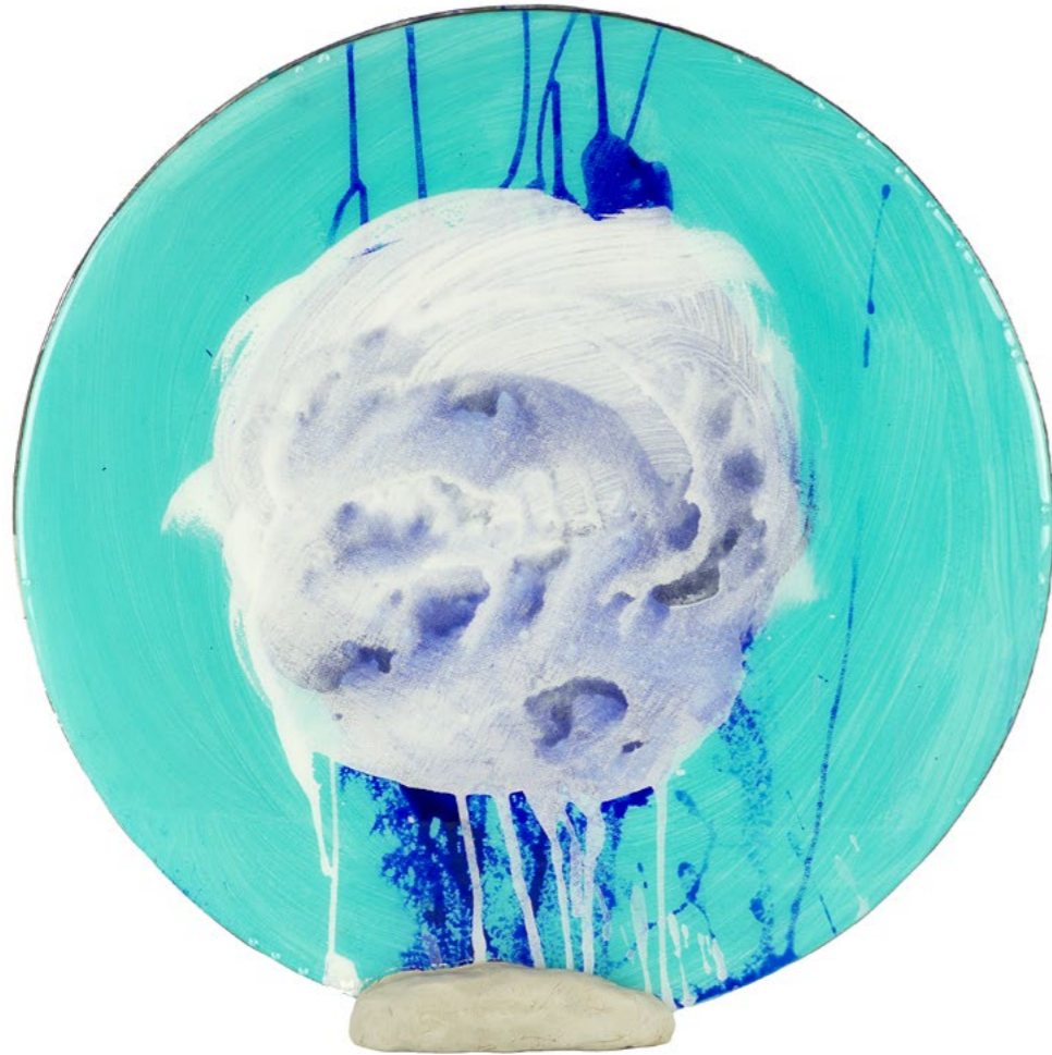
IO1, 2014 sculpture with oil paint on canvas in liquid gloss and clay 40 cm diameter + 1 cm clay pedestal