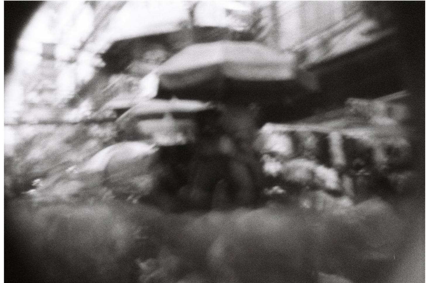
Sous le soleil toujours / Always under the sun, 2015, 1/8 C-print on aluminium 40 x 60 cm