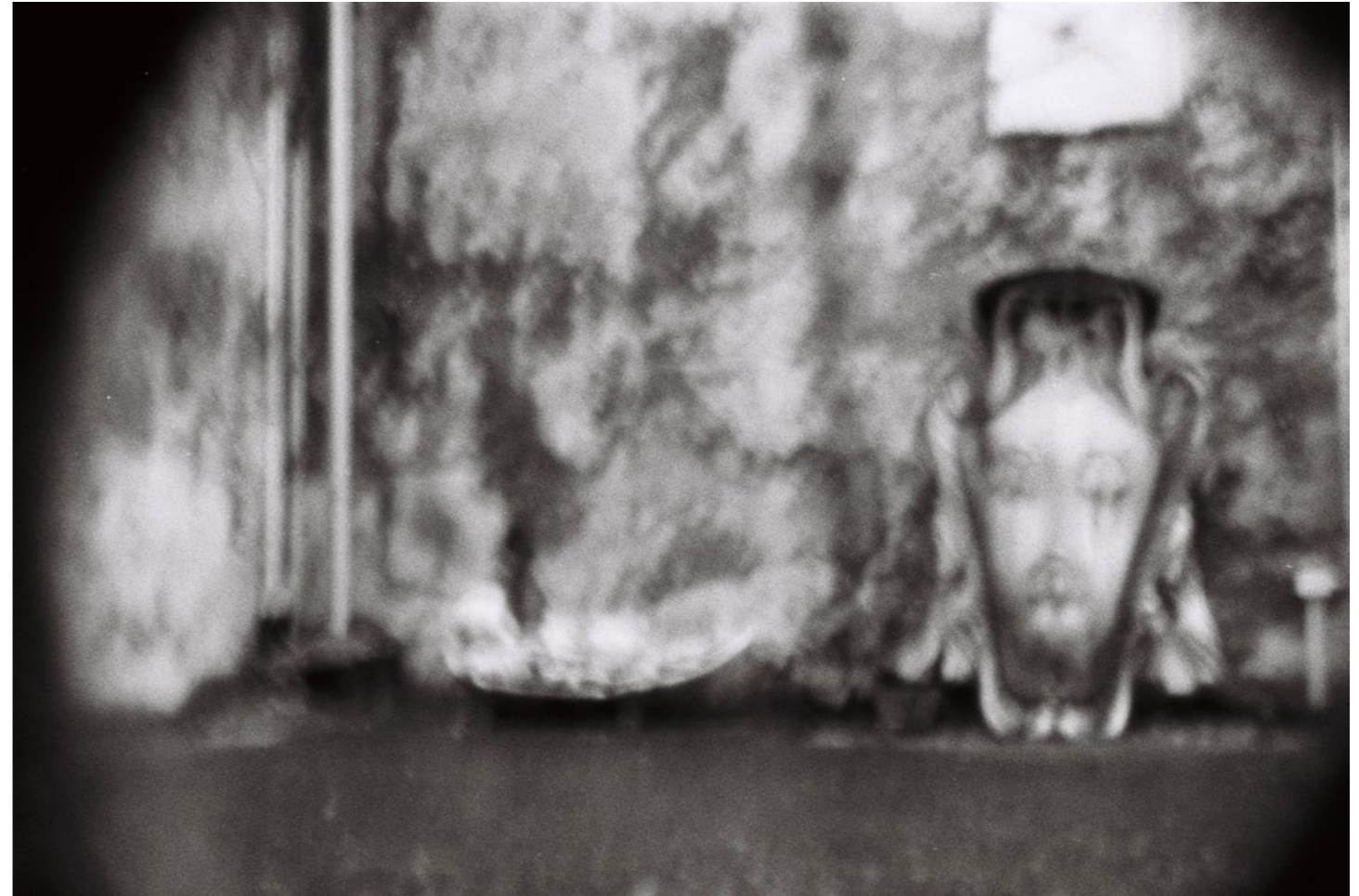
Ten Thousand Things, 2015, 1/8 C-print on aluminium 40 x 60 cm