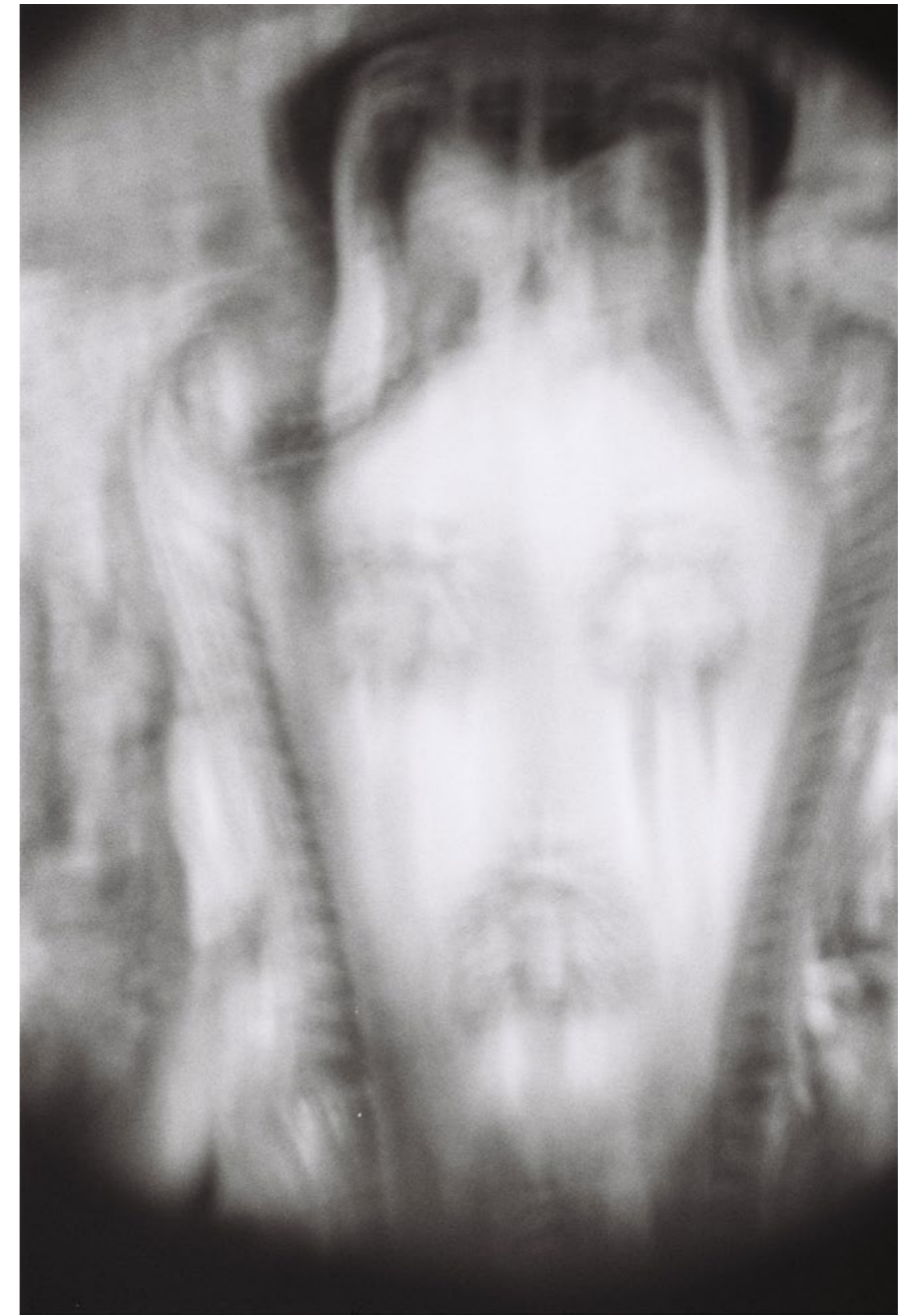
Temporarily Ceasefire, 2015, 8/8 C-print on aluminium 150 x 100 cm