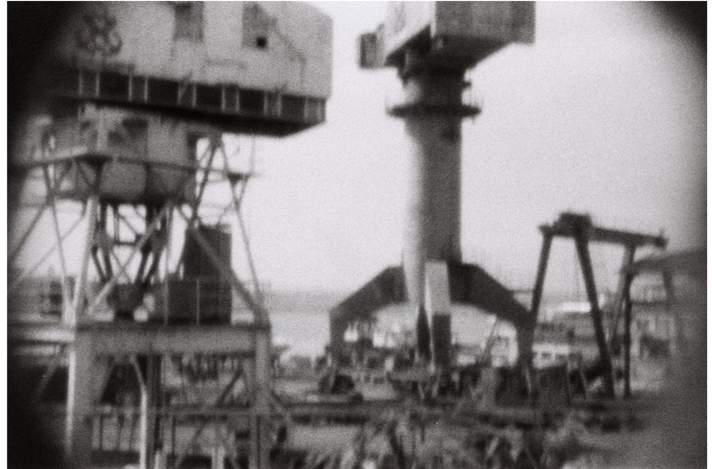
Just when you want to wiggle your hips, 2015, 1/8 C-print on aluminium 100 x 150 cm