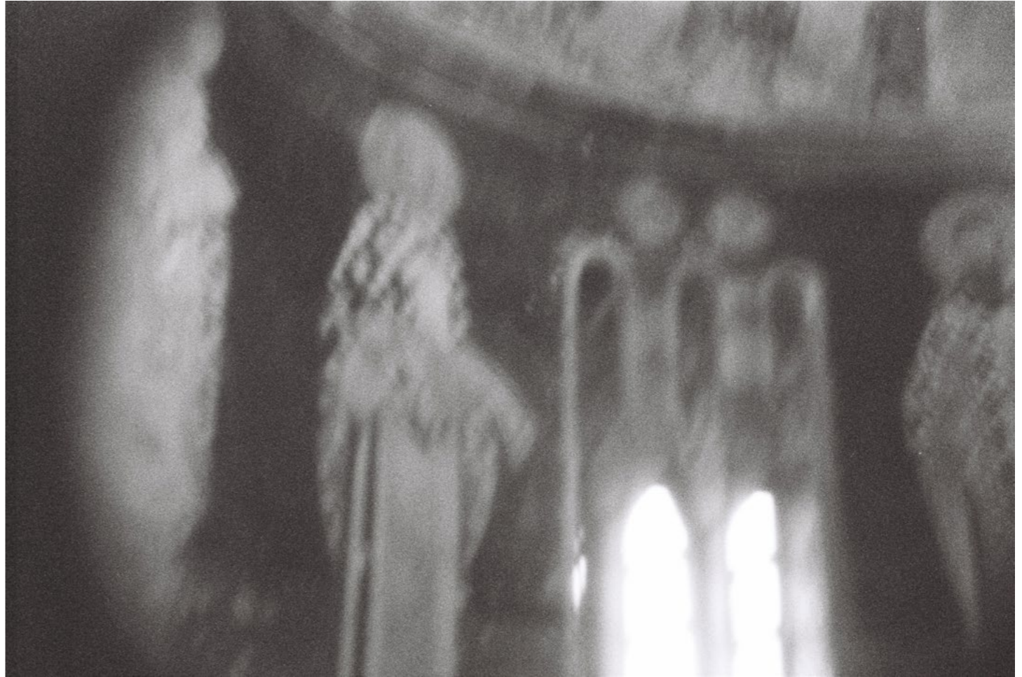
For Sure It Exists, 2015, 2/8 C-print on aluminium 40 x 60 cm