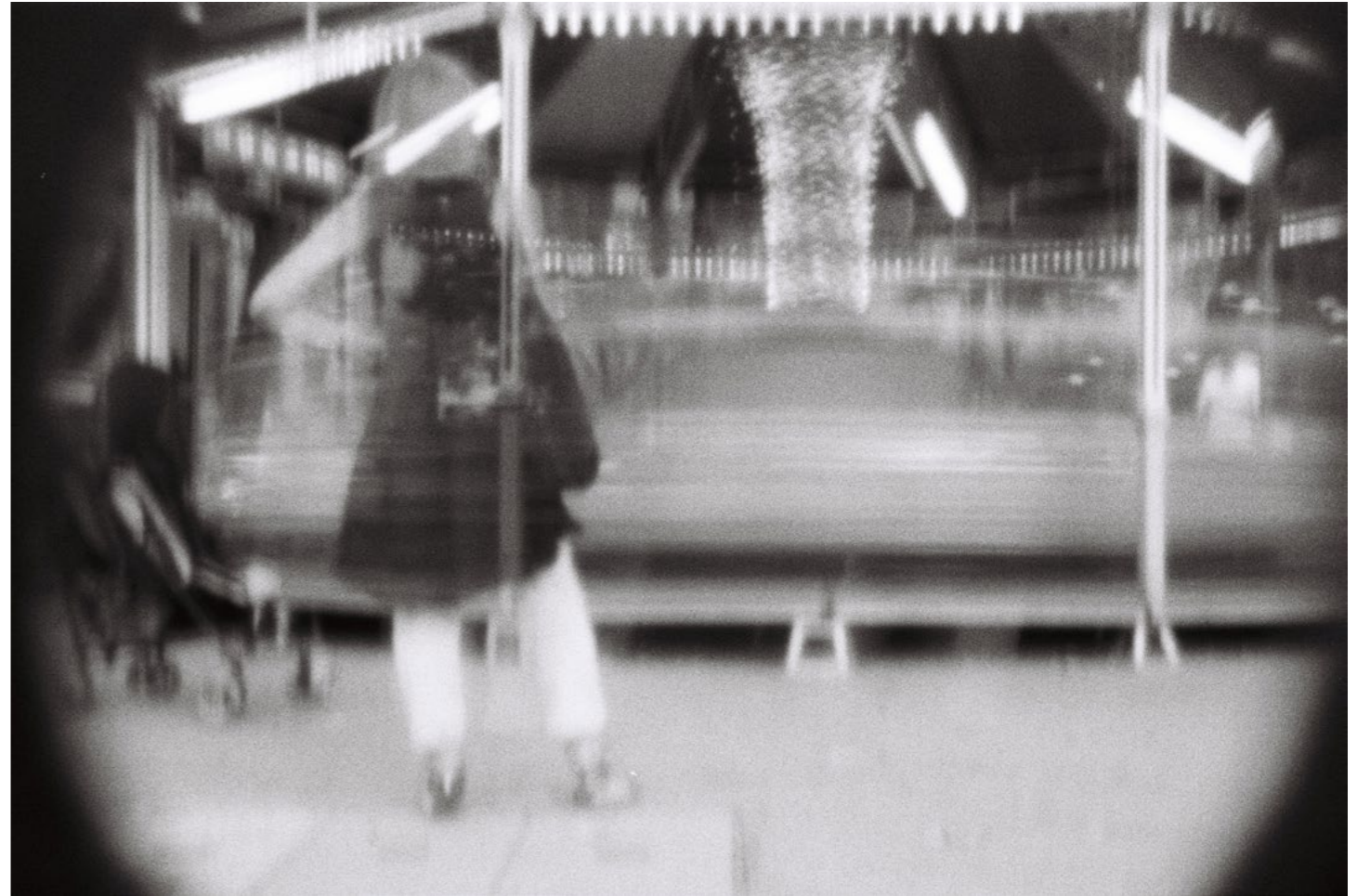
Horses do not dance but you do, 2015, 2/8 C-print on aluminium 100 x 150 cm